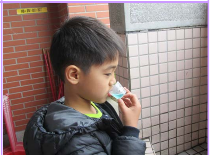
餐後用專屬小牙杯含氟在口中漱漱口