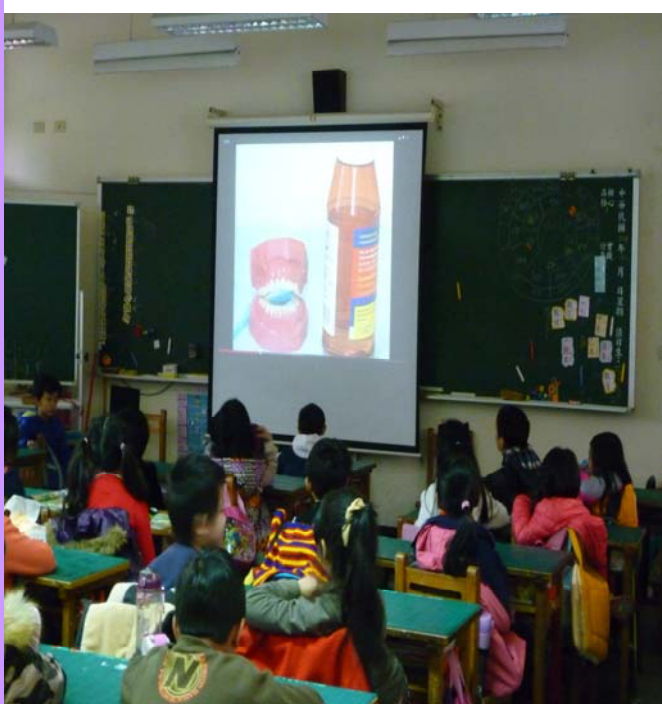
導師播放影片教導正確的刷牙方式