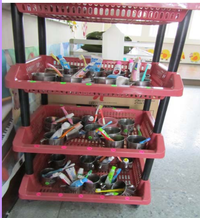
班級牙刷用具擺放整齊