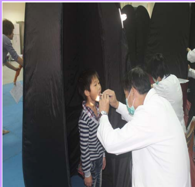
張大嘴巴，檢查一下有沒有蛀牙